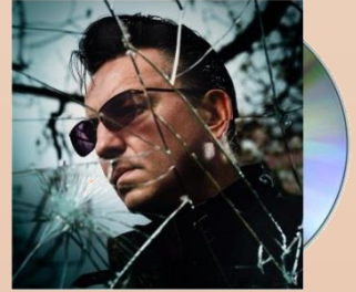
PLG UK Frontline, 2015

Plakları her döndüğünde, 1960'lı yıllarda müzik dünyasını kasıp kavuran Roy Orbison'ı hatırlatan, adeta onun bayrağını, sesini, ruhunu günümüze taşıyan Richard Hawley'in 3 yıl aradan sonraki yeni albümü, Eylül 2015 tarihli "Hollow Meadows" çok yeni piyasaya çıktı.